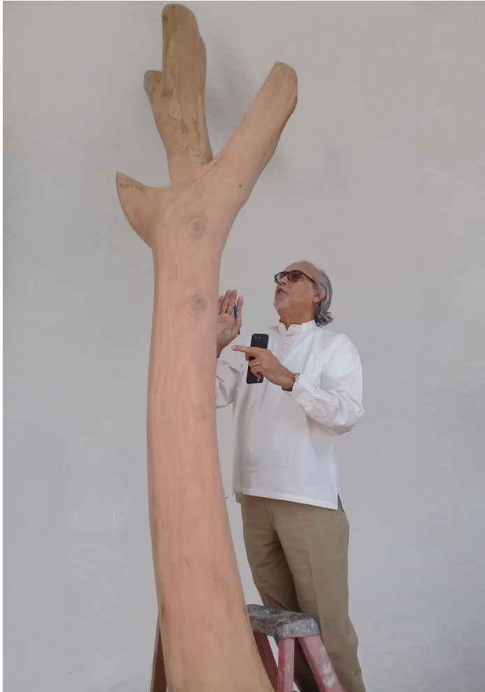
El autor de la obra durante el proceso de transformación del tronco en la escultura emblemática que promueve valores de preservación ambiental.

obra escultórica. El trabajo se realizó bajo los procedimientos que indica la técnica de taracea, una pericia antiquísima que se aplica en revestimiento de paredes, muebles, esculturas y otros objetos artísticos.