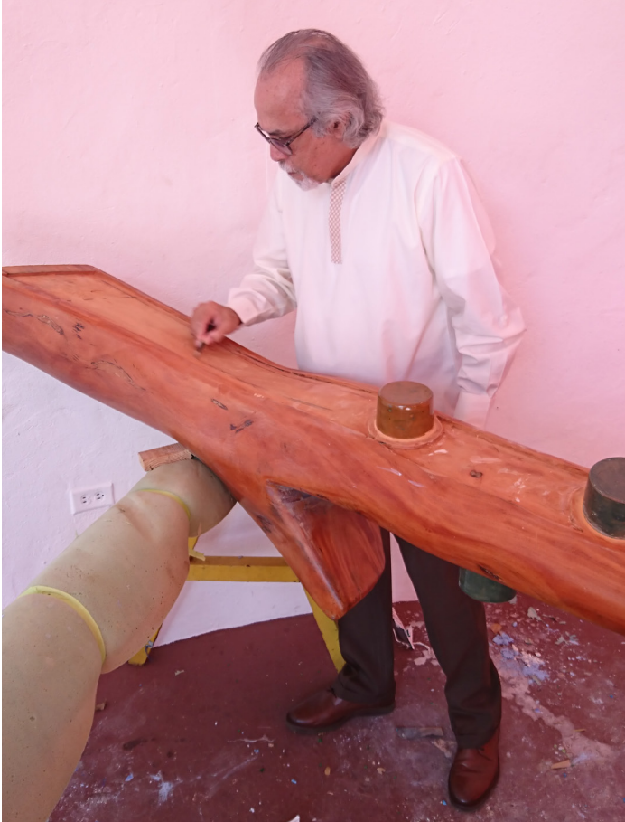
El autor en plena ejecución de su obra.