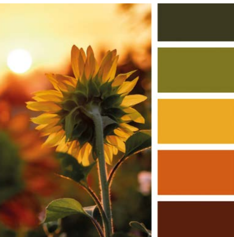
Paleta de colores del documental, número 4390.

El tratamiento visual de Wifredo, el legado de un genio del lente (2025) no solo cumple con una función estética, sino que también construye el sentido narrativo y emocional del documental sobre el padre de la fotografía contemporánea dominicana. Bordwell (2007) plantea que las elecciones cinematográficas como el encuadre, el color y la iluminación configuran un lenguaje visual que guía la interpretación del espectador. En esa misma línea, Elsaesser y Hagner (2015) argumentan que el cine contemporáneo debe ser comprendido a través de los sentidos, y que el estilo visual es fundamental para generar una experiencia inmersiva, no solo racional, sino corporal y emocional.