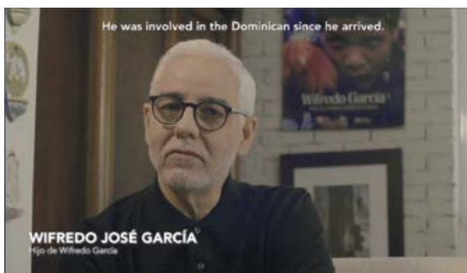
Fotograma del documental.

El uso de los diversos planos y ángulos permite guiar la experiencia del espectador, manipular su tensión narrativa y definir la identidad visual propia del filme.