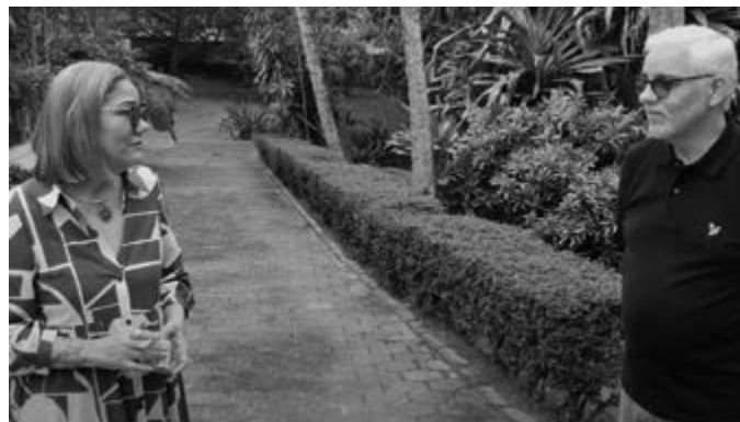
Relación de aspecto 16:9 a blanco y negro.