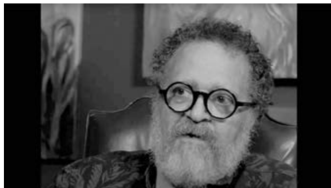
Relación de aspecto 4:3 a blanco y negro.