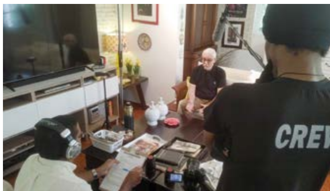
Detrás de cámara.

La relación de aspecto del documental se divide en tres formatos: la primera es el formato 16:9, de relación panorámica, que se emplea desde el minuto 00:00 al 52:46, con un contraste óptico a full color, lo que trasmite una atmósfera cálida mientras se narra la vida y obra del artista. La segunda dimensión es la visual 4:3, de relación cuadrada desde