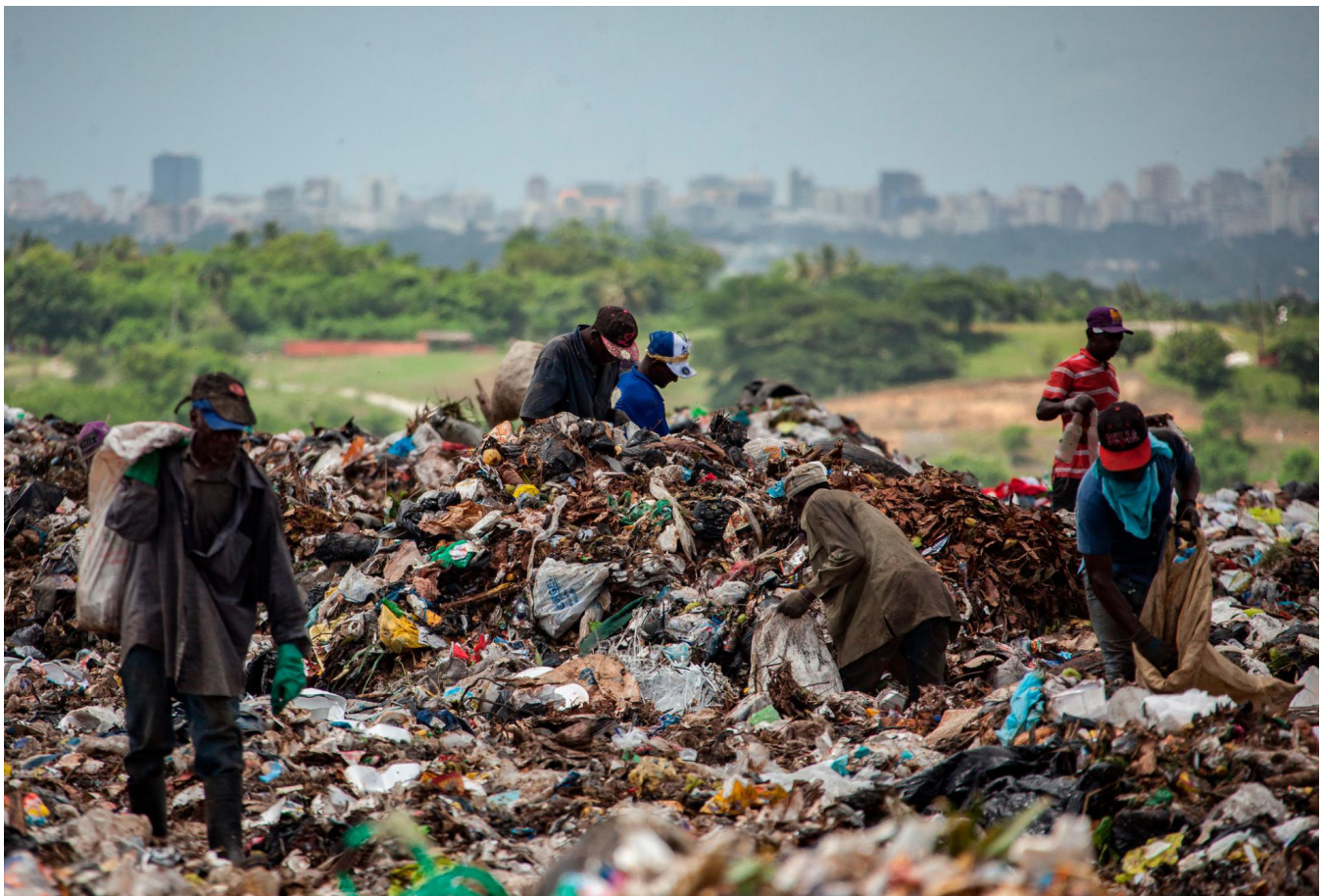
Ilustración 6. Duquesa, un grave problema ambiental y de salud.

descontrol en la gestión de residuos en el país. Ese vertedero recibe basura de diversas partes del país, principalmente de la capital y sus alrededores. Además de los impactos en la salud y el medio ambiente, los vertederos como Duquesa contribuyen significativamente a la emisión de gases de efecto invernadero, lo que agrava el cambio climático.