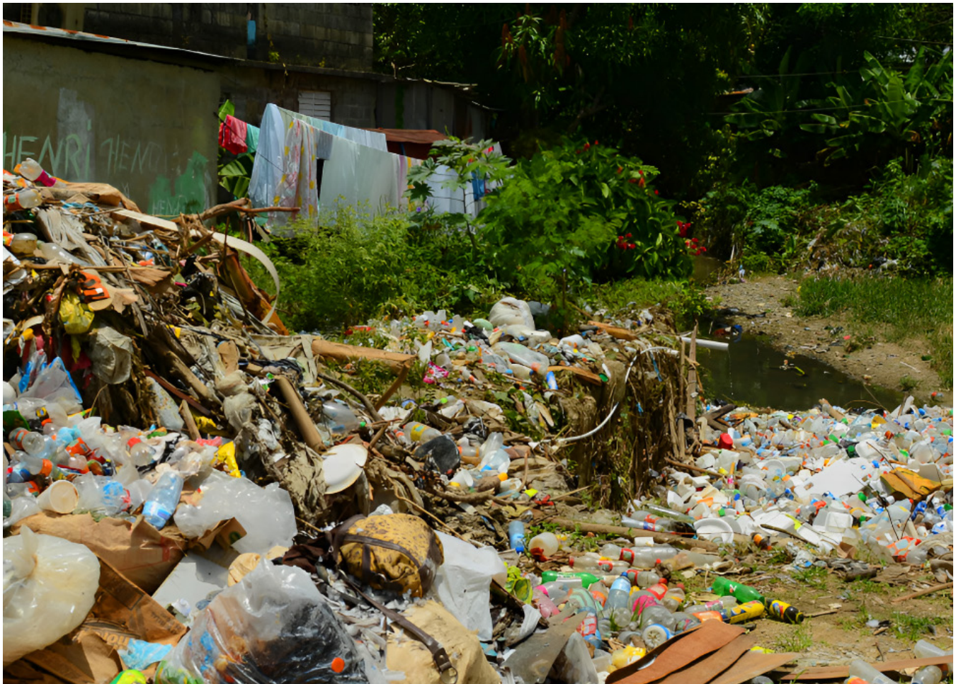
Ilustración 3. De lo establecido a lo percibido: residuos sólidos en Santo Domingo y el Distrito Nacional.

debe, en parte, a la relevancia del sector turístico y al consumo residencial. De manera similar, otras islas de la región con una fuerte actividad turística también presentan tasas más altas de generación de residuos (World Bank, 2018).