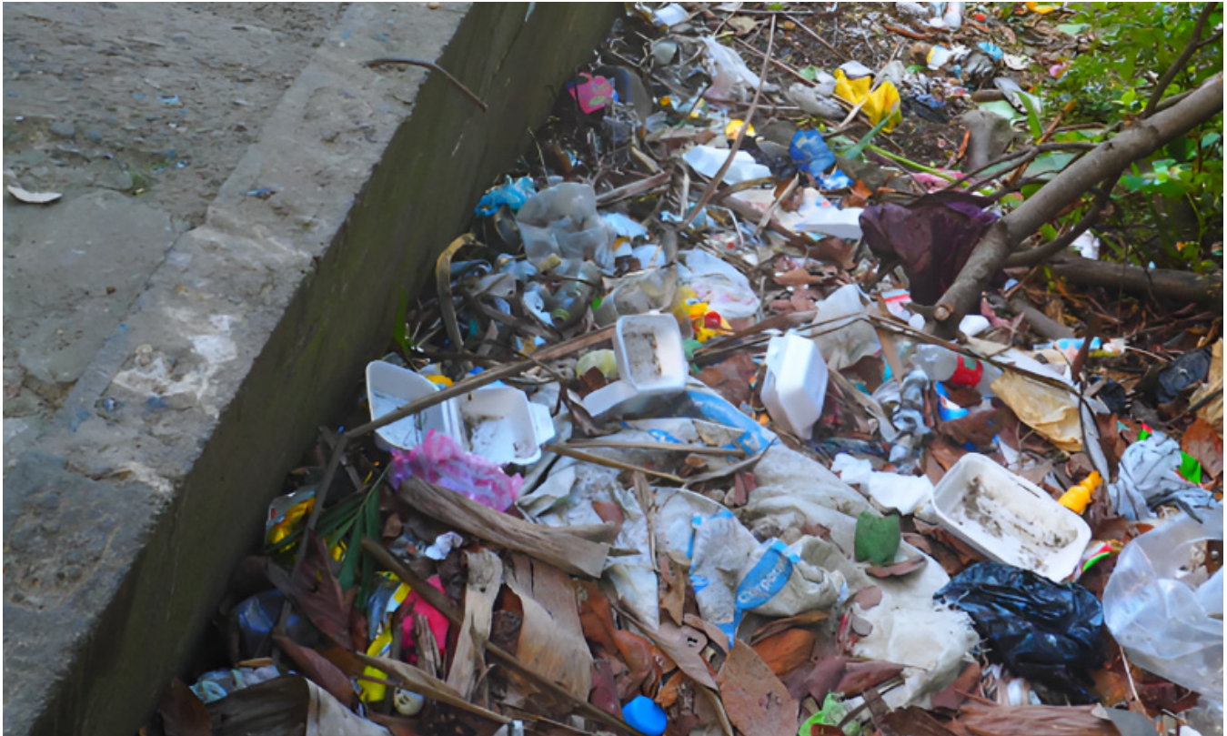
Ilustración 1. De lo establecido a lo percibido: residuos sólidos en Santo Domingo y el Distrito Nacional.

Esos vertederos son espacios donde los residuos se acumulan sin control, lo que provoca una serie de consecuencias graves para la salud pública, la temperatura media del planeta y el medio ambiente.