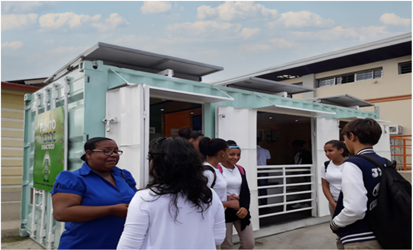
Ilustración 7. Jornada de implementación de la guía de procesos y procedimientos Puntos Verdes.

el ámbito de políticas públicas y asistencia técnica se ha ejecutado 1.1 millón de dólares, lo que refleja un progreso en la implementación de las estrategias definidas en las Contribuciones Nacionalmente Determinadas del 2020 (Relova Delgado, 2024). Iniciativas como la instalación de Puntos Verdes en barrios como Los Pepines, de Santiago, y los esfuerzos de educación y sensibilización sobre la separación de residuos son pasos positivos, pero se necesita un cambio cultural más amplio que implique la participación de toda la ciudadanía.