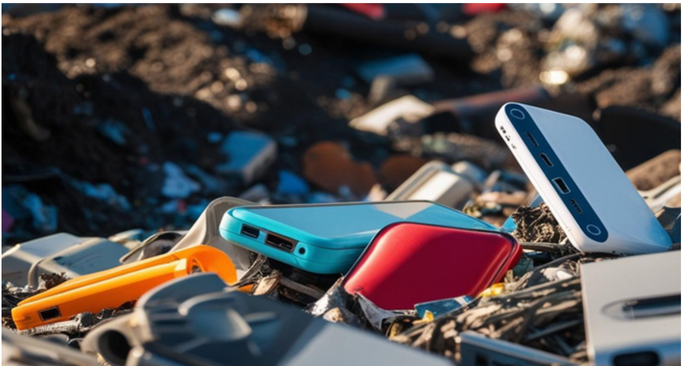
Ilustración 4. Obsolescencia programada.

La mejora rápida del producto hace que las compras de valor para el consumidor realizadas ahora sean más que cuando las mejoras no son visibles. Aunque la fuerza impulsora detrás de esa práctica es garantizar que los productos usados no compitan con los nuevos, estos deberían estar mucho mejor que sus predecesores para instigar el reemplazo, ya que es poco ético producir productos que tienen vida económica corta (P. A. Grout and I.-U. Park, 2001).