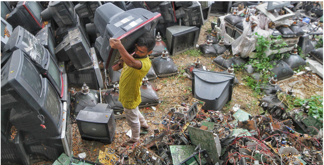
Ilustración 5. Montaña de residuos electrónicos en un vertedero.

Además de las modificaciones en los estándares y del tiempo de garantía de los productos adquiridos, el impacto negativo de la obsolescencia programada y la cultura de consumo es una realidad preocupante. La constante renovación de dispositivos y bienes de uso cotidiano genera un volumen creciente de residuos, lo que acelera la acumulación de desechos y aumenta la presión sobre los sistemas de gestión de residuos. Esa problemática se refleja de manera evidente en los vertederos a nivel mundial, y República Dominicana no es la excepción. La falta de estrategias efectivas para la reutilización y el reciclaje, sumada a hábitos de consumo insostenibles, convierte esos espacios en testigos de un modelo de producción que urge replantear.