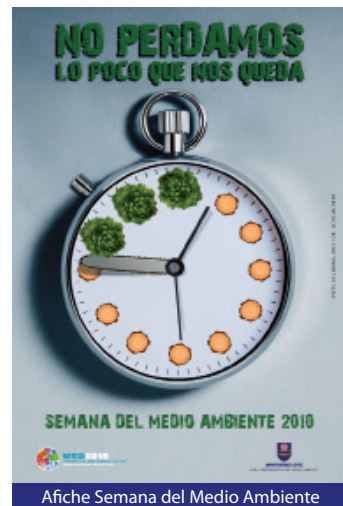
Afiche Semana del Medio Ambiente