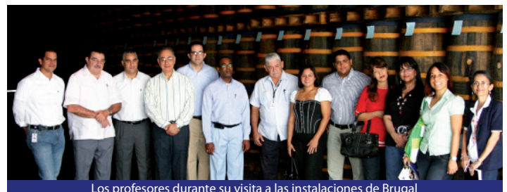
Los profesores durante su visita a las instalaciones de Brugal