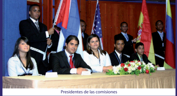
Presidentes de las comisiones

Durante un día completo, los estudiantes del Colegio APEC Minetta Roques (Colapec) en el simulacro del Modelo de las Naciones Unidas (Minu-Colapec 2010). Un Consejo Económico y Social, una Cumbre sobre el cambio climático y tres comisiones de Asamblea General,