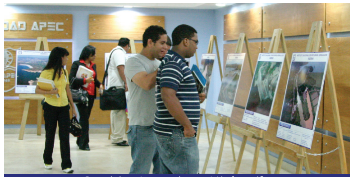
Parte de los asistentes a la exposición fotográfica

La conferencia "Los recursos hídricos y el manejo del agua en la República Dominicana", a cargo del ingeniero Frank Rodríguez, director general del Instituto Nacional de Recursos Hidráulicos (INDHRI), dio apertura a la Semana del Medio Ambiente celebrada por la Universidad APEC (UNAPEC) con motivo del Día Mundial del Medio Ambiente que se conmemoró el pasado 5 de junio.