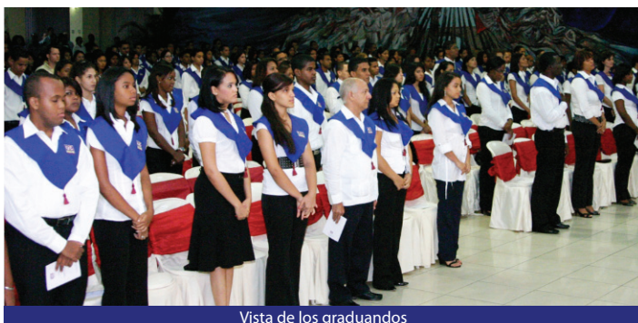
Vista de los graduandos

y ocho en Español como segunda lengua, dieciocho en Italiano, once en Portugués, siete en Francés y siete en Japonés.