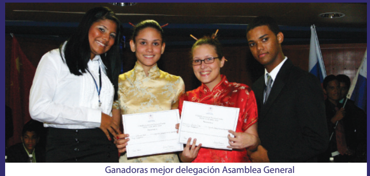
Ganadoras mejor delegación Asamblea General

conformaron los equipos que sesionaron a fin de buscar soluciones a los problemas mundiales; de los cuales fueron reconocidas las mejores comisiones atendiendo al mejor papel de posición, mejor discurso, mención de honor, delegación distinguida y mejor delegación.