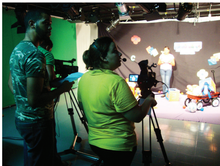
Vista del estudio

Asimismo, el moderno espacio también cuenta con una cabina con todos los recursos de la tecnología digital para que el estudi-