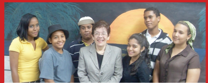
Janet Miller junto a estudiantes de los Colegios APEC

Estudiantes del 2do. bachillerato de los colegios APEC Fernando Arturo de Meriño (CAFAM) y Minetta Roques (Colapec) realizaron un encuentro con la escritora Jeannette Miller en el que le presentaron los ensayos escritos por ellos basados en la lectura de la obra La Vida es otra cosa, de la autoría de Miller.