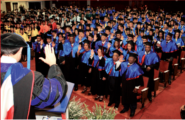
Los estudiantes hacen su juramento como nuevos profesionales