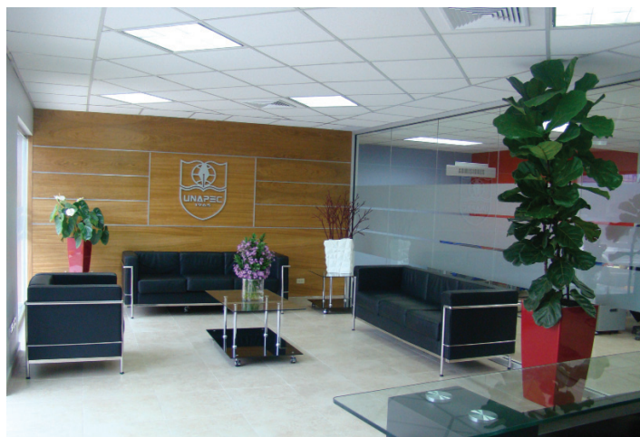
Nuevas oficinas CENSE

En el CENSE, las atenciones a los estudiantes son facilitadas tanto de forma presencial como telefónica. Las instalaciones físicas de las áreas cuentan con internet inalámbrico, computa-