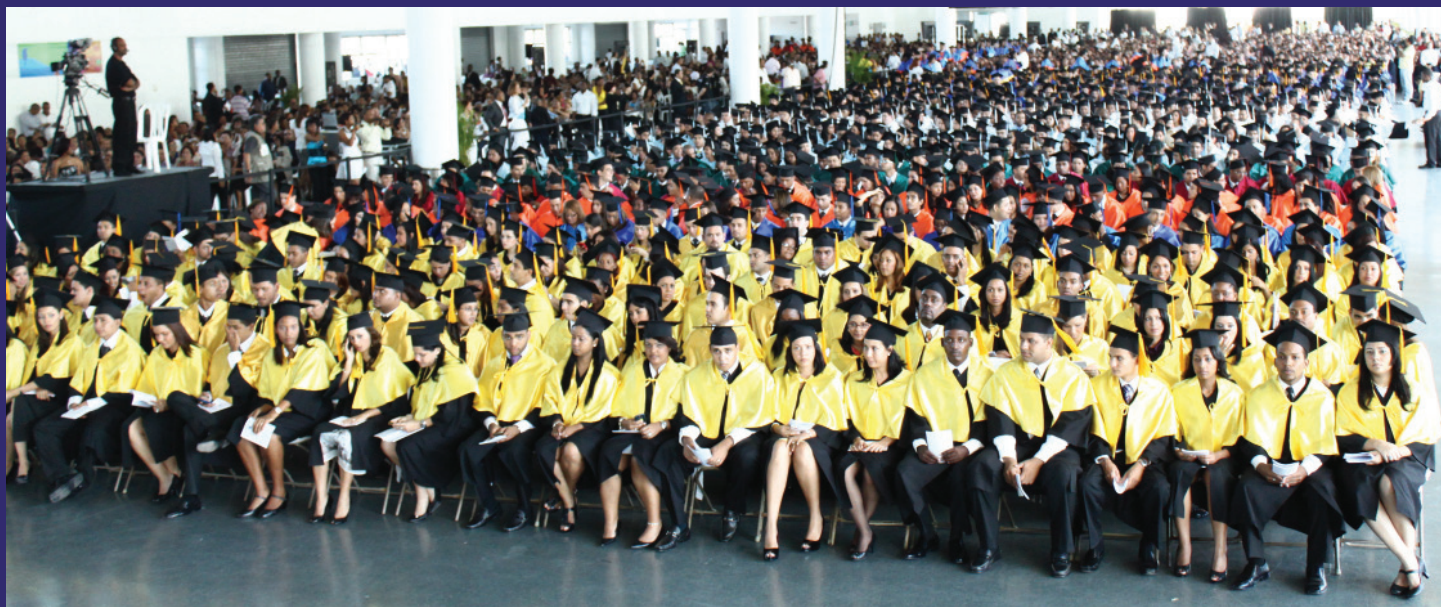
Vista de los 1,054 graduandos