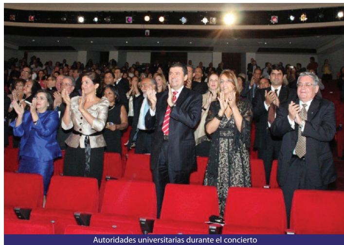
Autoridades universitarias durante el concierto

En el desarrollo y uso de la tecnología para procesos académicos y administrativos, la inversión ha sido cuantiosa hasta ganar un importante liderazgo nacional; con orgullo exhibimos docentes en más de un noventa por ciento de ellos con nivel postgraduado; una infraestructura cada vez más moderna, versátil, segura y confortable; una gestión académica y administrativa, eficiente y ágil, signada además por una cultura de planificación estratégica, de calidad y de evaluación continua; con un número de egresados que supera los veinte mil, entre los cuales podemos contar a algunos de los principales líderes empresariales y de los más exitosos emprendedores de nuestro país.