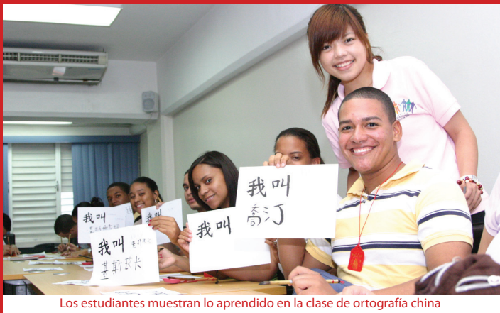
Los estudiantes muestran lo aprendido en la clase de ortografía china

Durante todo un día los Embajadores Jóvenes de Taiwan 2010, estudiantes de la Universidad Providence de Taiwan, estuvieron en las instalaciones de UNAPEC donde agotaron una amplia agenda que incluía los cursos sobre la cultura de los templos, de caligrafía, de introducción a Taiwan (geografía, cultura, lugar turístico), además de que impartieron clases de artes marciales. La delegación también pudo apreciar parte de la cultura criolla con el desarrollo de una dinámica con los instrumentos típicos dominicanos, así como la presentación artística de baile de merengue y pantomima.